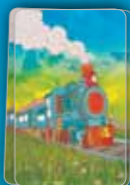
Стопка карт вагонов и действий